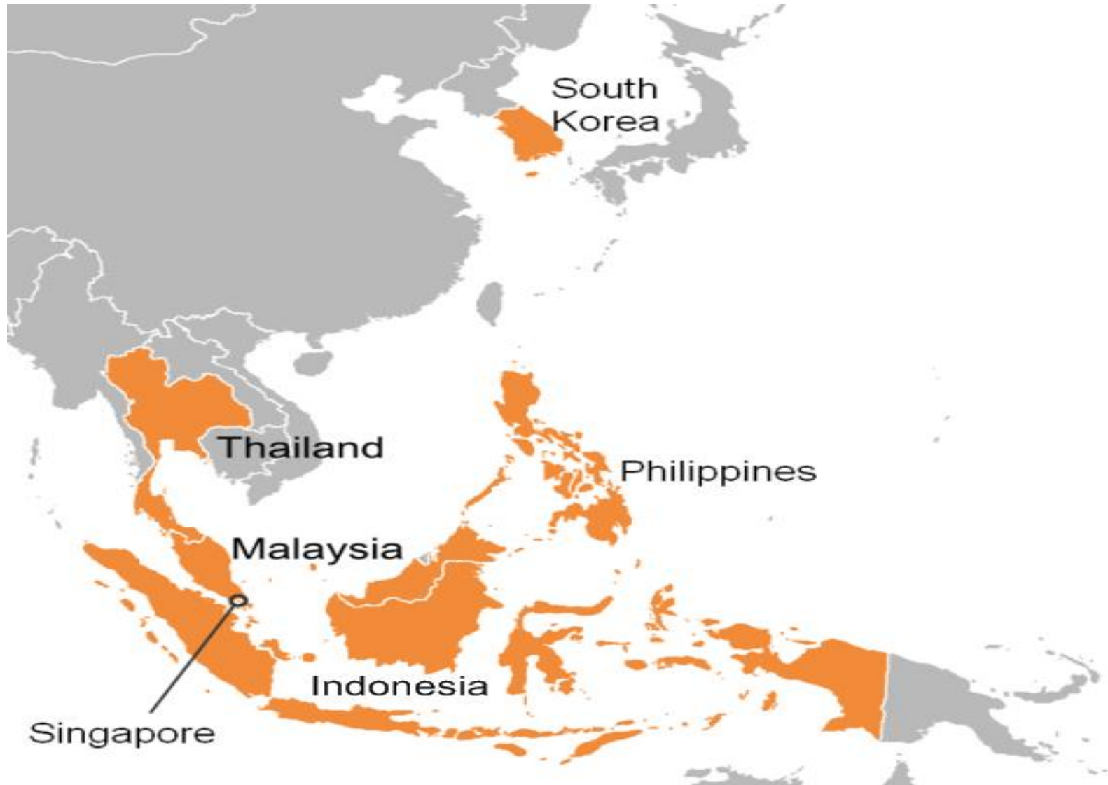
Countries that were most affected by the 1997 Asian Financial Crisis