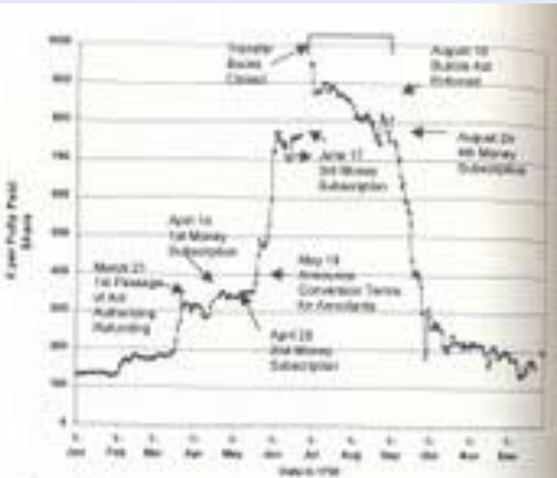
Figure 17.1 Daily South Sea Share Prices, 1720. Data courtesy of Larry Neal.