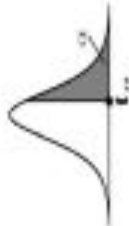
Percentage Points of the t Distribution; t_{v, \alpha} P(T > t_{v, \alpha}) = \alpha